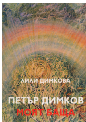
Тази връзка е двойна.

В случая нас ни интересува връзката Димков - Тибет.