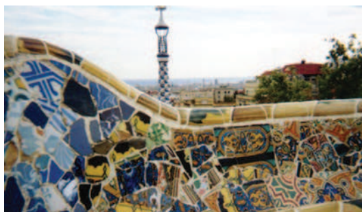
Мозайката на терасата в парка Гюел

Антони Гауди е роден на 25 юни 1852 година близо до старата каталонска столица Тарагона в семейство на медничари. На 26 годишна възраст получава титлата архитект. Съдбата го среща с богатия индустриалец Еузебио Гюел, който финансира проектите му. Плод на тяхно-