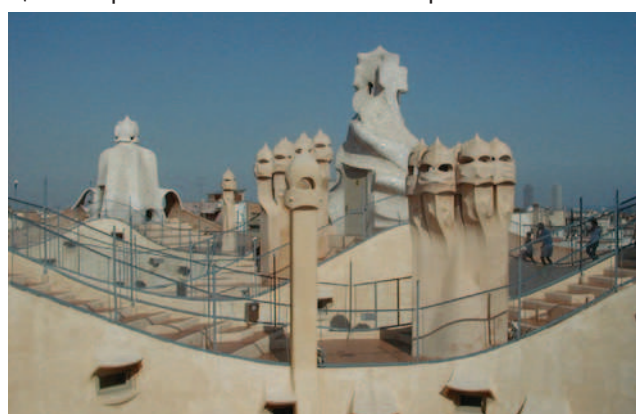
Покривът на къща Мила

поръчали на Антони Гауди разкошна къща в богаташки квартал и строежът започва през 1905 година. Абстрактната структура на къщата се вписва в природата на Барселона. Планината и морето вдъхват Гауди за вълнообразния силует на къщата. Мила представлява овална сграда, релефна със сложна орнаментика. Сградата има открит покрив за разходки, където са разположени статуи. Някои ги определят като рицари, за други статуите представляват религиозни фигури, а повечето споделят тезата за кацнали извънземни. Всъщност това са оригиналните комини на къща Мила. Цялостният проект на къщата заедно с вътрешния дизайн е проектиран от Гауди. Вратите и прозорците са с нестандартно затваряне. Има асансьор. Витражите, модерното обзавеждане и дори сервизите за кафе носят почерка на великия архитект. Интериорът омагьосва, провокира и пренася в друго измерение. Ражда се шедевър - къща Мила е определена от специалистите за най-завършеното и зряло в архитектурно отношение произведение на Гауди.