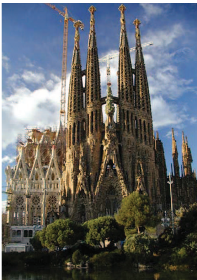
Църквата Саграда Фамилия

га на храма са изсечени релефни фигури, разпятия, кошници, кръстоносци, кости и черепи. Пясъчните кули с причудливи форми са украсени на върха с плодове - портокали и ябълки. Гениалното творение е замислено с 18 кули. Строежът на шокиращата църква - символ на Барселона, все още продължава. Саграда Фамилия остава недовършена поради нелепата смърт на Гауди - блъска го трамвай и умира, но завинаги приютява духа му в недра на храма, където е погребан.