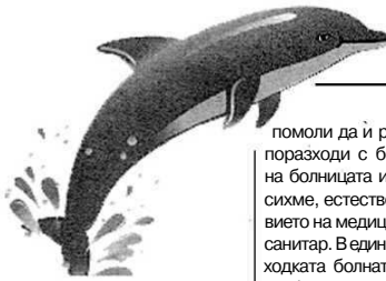
(Продължение от минималия брой)

Тя изглежда заподозря нещо, питаше кога ще я изписваме. Предположихме, че се опитва да се преструва и затова, когато родителите й дойдоха да вземат детето, беше решено тя да бъде оставена при нас още малко. Жената